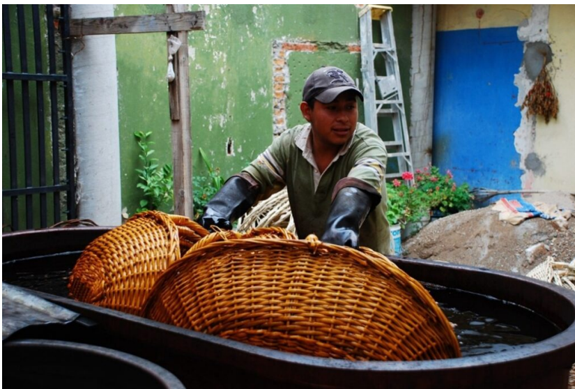
Ein mexikanischer Landwirt bei der Färbung geflochtener Körbe

Eine weitere Erfolgsgeschichte ist die Zusammenarbeit der SKG mit dem Fintech Startup Agroclimatica ( http://Agroclimatica ) aus Dänemark. Es stellt eine Plattform zur Verfügung, die es den SKG mit Hilfe von hinterlegten Boden- und Klimadaten ermöglicht, das Klimarisiko eines Agrarkredits einzuschätzen. Das wird insbesondere in Gegenden, die bereits jetzt vom Klimawandel stark betroffen sind, immer wichtiger, um Risiken eines Ernteausfalls und damit eines Kreditausfalls vorzubeugen. Mit Hilfe der GPS-Daten der Anbaufläche vergleicht die Plattform die vorherrschenden Standortbedingungen (Bodenbeschaffenheit, Niederschlagsmenge, Temperatur, Höhenlage etc.) mit den Standortanforderungen des anzubauenden Agrarprodukts. Stimmen Standortbedingungen mit Standortanforderungen überein, gibt die Plattform grünes Licht für den Agrarkredit. Werden Differenzen festgestellt, wie etwa, dass das anzubauende Agrarprodukt mehr Wasser verbraucht als die Niederschlagsmenge hergibt, weist die Plattform auf das konkrete Risiko hin. Sie bietet dann Vorschläge zur Risikoreduktion bzw. schlägt alternative Anbauprodukte vor, die an die vorherrschenden klimatischen Bedingungen besser angepasst sind und einen höheren Ertrag versprechen. Damit ist es sowohl für den Landwirt als auch die SKG eine Win-Win-Situation.