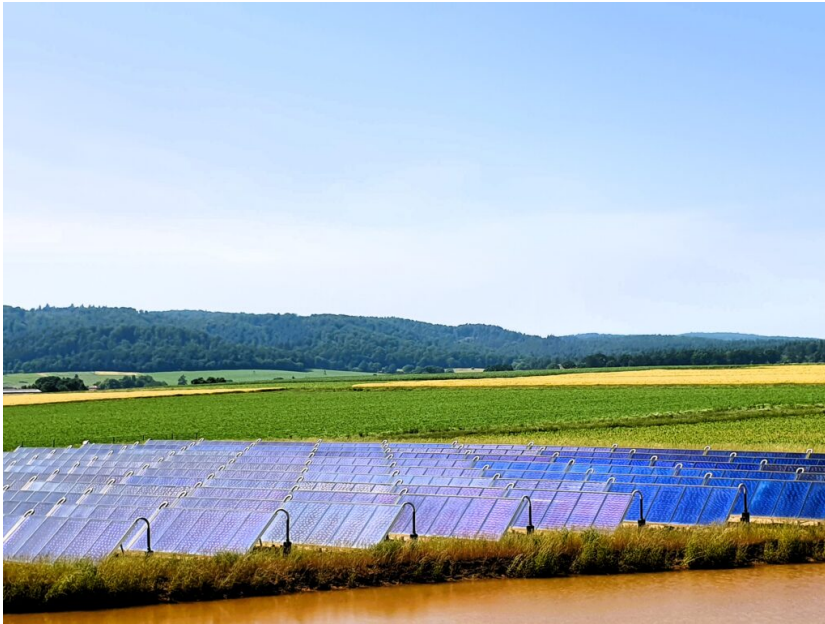
Solarthermie-Anlage der Solarwärme Bracht eG

Die Speicher sollen jedoch nicht nur als Verbraucher eine Rolle spielen, sondern auch einspringen, wenn das Angebot an Wind- und Solarstrom nicht die Nachfrage decken kann. So sollen die Batterien von Elektroautos nicht nur flexibel geladen werden, sondern auch bei einem fehlenden Angebot den Strom wieder einspeisen können. Dieses bidirektionale Laden von Elektroautos soll nach dem Koalitionsvertrag gefördert werden. Damit könnte die neue Bundesregierung auch die Kopplung der einzelnen Sektoren beschleunigen. Denn Strom wird im Mobilitäts- und im Wärmesektor eine wichtige Rolle spielen. Wärmenetze könnten etwa zunehmend große Wärmepumpen, die an einen örtlichen Windpark angeschlossen sind, als Wärmequelle nutzen. Und der Koalitionsvertrag bekennt sich auch wieder zu Biogasanlagen, die Strom in Zeiten von Dunkelflauten erzeugen können, und die gleichzeitig genossenschaftliche Wärmenetze versorgen.