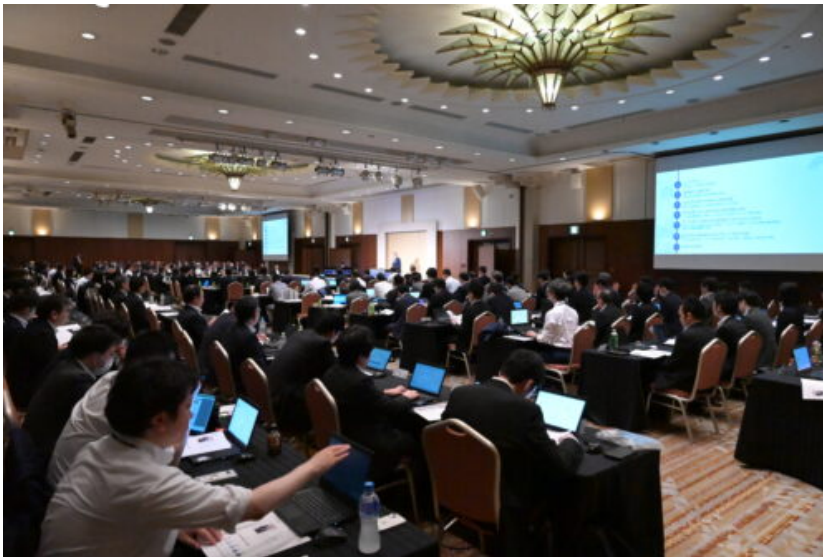
TKC-Kongress Fukuoka, Japan 19.07.2024

Im Juli 2024 fand in Fukuoka, Japan, der jährliche Kongress der TKC Cooperation statt, einer landesweiten Steuerberaterkooperation, die 1966 gegründet worden ist und zahlreiche Parallelen zu deutschen Verbundmodellen aufweist. Ich durfte auf diesem Kongress in einem Vortrag mit dem Titel "Resilience of Cooperatives and Cooperating Companies" die besondere Widerstandskraft kooperativer Organisationsformen in Krisenzeiten beleuchten. Auch im April 2025 standen bei weiteren Gesprächen mit der Unternehmensspitze der TKC Cooperation erneut die Perspektiven und Herausforderungen solcher Netzwerke im Mittelpunkt.