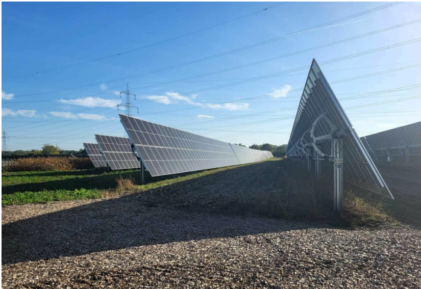
Agri-PV-Anlage im Energiepark Sonnenfeld Bruck/Leith

Um neue Projekte schneller voranzubringen, sollen bürokratische Hürden abgebaut und Planungs- sowie Genehmigungsverfahren vereinfacht werden. Laut Koalitionsvertrag soll dabei auch geprüft werden, ob Expertenpools eingerichtet sowie die Vereinfachungen aus Wind-Beschleunigungsgebieten auf andere Energieinfrastrukturvorhaben übertragen werden können. Die Flächenziele für den Windausbau gemäß Windflächenbedarfsgesetz für 2027 sollen erhalten bleiben. Die Ziele für 2032 sollen jedoch evaluiert werden. Entlastung dürfte dafür eine geplante Begrenzung der Flächenpachten bieten. Anmeldeverfahren sollen durch Digitalisierung und Standardisierung erleichtert werden, insbesondere für Solarstromanlagen mit Doppelnutzung, wie Agri- und Parkplatz-Photovoltaik.